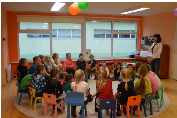
Tahkuranna lasteaed-algkool tunneb huvi merelise prügi ennetamise vastu

Prahistamine on seotud inimeste käitumisharjumuste ja väärtushinnangutega. Üldiselt on nii, et täiskasvanud inimese kombeid on raske muuta. See pärast on väga oluline kujundada lastes ja noortes õigeid väärtushinnanguid. Kohalikud omavalitsused, kes vastutavad koolide ja lasteaedade eest, peaksid lapsi ja noori informeerima prahistamise negatiivsetest tagajärgedest ning õigetest keskkonnavalikutest. Kui vallavanem peab oluliseks, et piirkonna rannik on prügivaba, siis ei ole keeruline 5-10% kogukonna liikmete kaasamine parema keskkonnaseisundi saavutamiseks. Olles selle kriitilise piiri ületanud, saavutame juba positiivse muutuse kogukonnas tervikuna. Ka vähemteadlikud inimesed, kes prügiga lohakalt ringi käivad, püüavad siis muuta oma käitumist, kartes muidu avalikku hukkamõistu või kogukonnas tõrjutuks jäämist. Tähtis on, et seataks eesmärk – soovitakse luua paremat keskkonda kõigile!