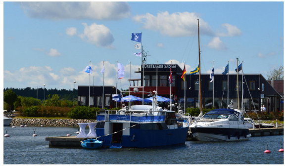
Kuressaare sadamas lehvib sinine Kotkalipp

Kohalikud omavalitsused ja väikesadamad peavad looma kaasaegsed prügi vastuvõtu ja üleandmise tingimused. See hõlmab stabiilset prügiveedu ning jäätmete liigiti kogumise süsteemi. Piisaval hulgal prügikaste randades ja sadamakaidel motiveerivad inimesi prahti õiges kohas ära viskama, vähendades nii merre sattuva prügi kogust. Kogukonnad, kellel on avalikud rannad, võivad igal aastal korraldada ühiseid ranna koristustalguid, näidates nii ka lastele, et ranna puhtust tuleb väärtustada. See on juba peaaegu terve võit, kui väärtushinnangud on paigas.